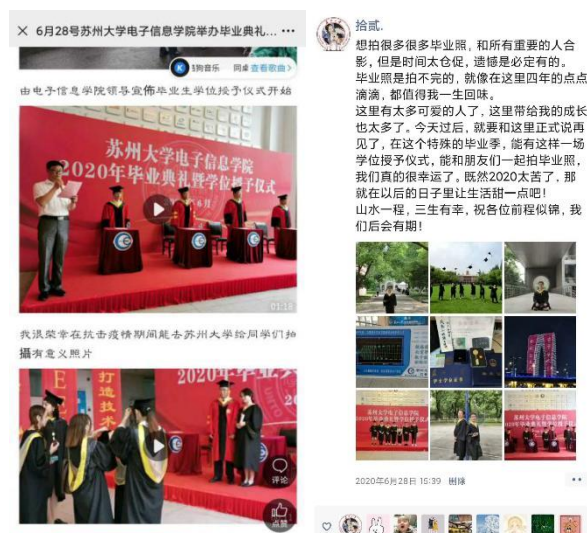
活动结束后老同志和同学们发布的朋友圈

活动结束后，同学们纷纷在朋友圈、微博分享学位授予仪式的照片，对学院的暖心安排和老同志们的辛勤付出表示由衷的感谢：“谢谢各位老师为我们留下了宝贵的毕业纪念！谢谢你们！”