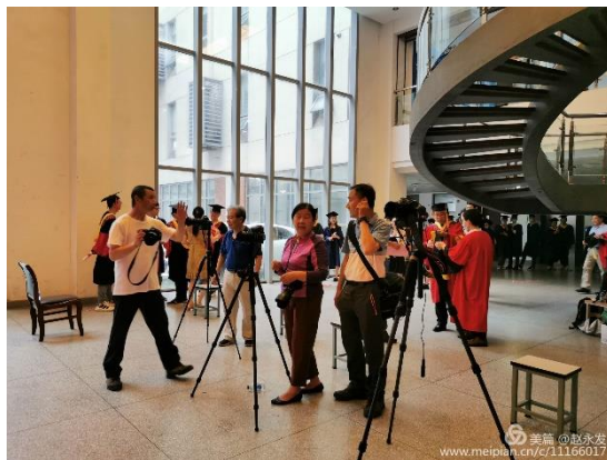
老同志在进行拍摄前的准备工作

2020 年 6 月 28 日上午 8 点，梅雨季的苏州淅沥下着小雨，位于苏州大学天赐庄校区的电子楼里，为 2020 届毕业生们举办的专属毕业典礼和学位授予仪式马上就要开始了。此时，受邀前来参与毕业照拍摄的五位老同志、老教师也已早早来到了现场，正在架设机器，调整机位，进行相关的准备工作。