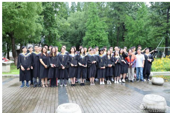
老同志为同学们拍摄的合影

“同学，再靠近老师一点”“同学，下巴收一下”“同学，看这里，笑得再开心一点”……类似这样的提醒贯穿了整个学位授予仪式，在这两个小时里，每一位上台的同学都会在老同志的提醒下摆出最好看的 pose，露出最美丽的笑容，而这美好的一刻，则被老同志通过相机永远的保存下来。在整场仪式中，五位老同志共为近 400 名毕业博士研究生、硕士研究生和本科生累计拍摄了 2000 余张照片，由于整个活动不间断进行，活动全程他们忙的一口水都来不及喝，生怕错过同学们最精彩的一刻。