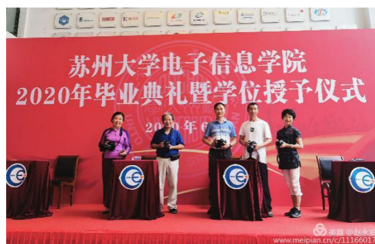
参与拍摄工作的五位老同志

活动结束后，同学们纷纷在朋友圈、微博分享学位授予仪式的照片，对学院的暖心安排和老同志们的辛勤付出表示由衷的感谢：“谢谢各位老师为我们留下了宝贵的毕业纪念！谢谢你们！”